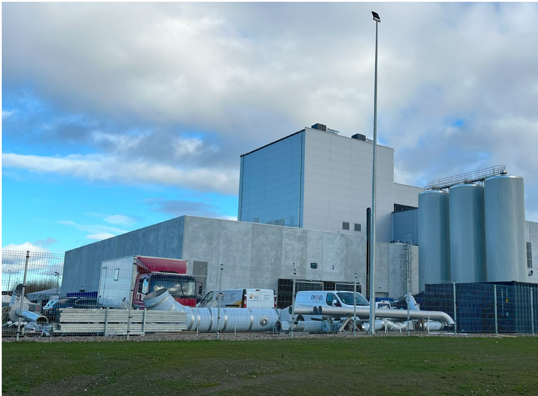
Meelunie GPI Proteinfabrik, Hedensted.