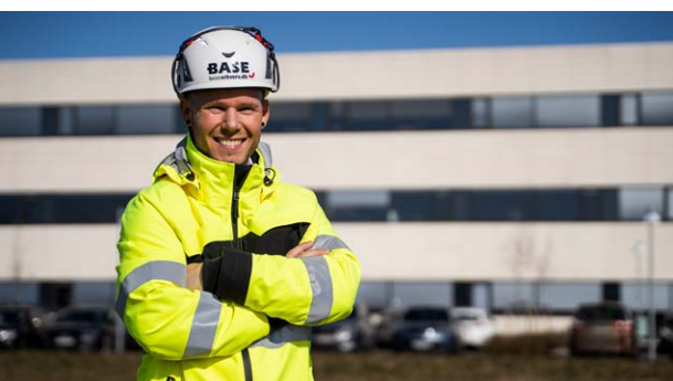
Hovedkontoret på Erhvervsbyvej i Horsens