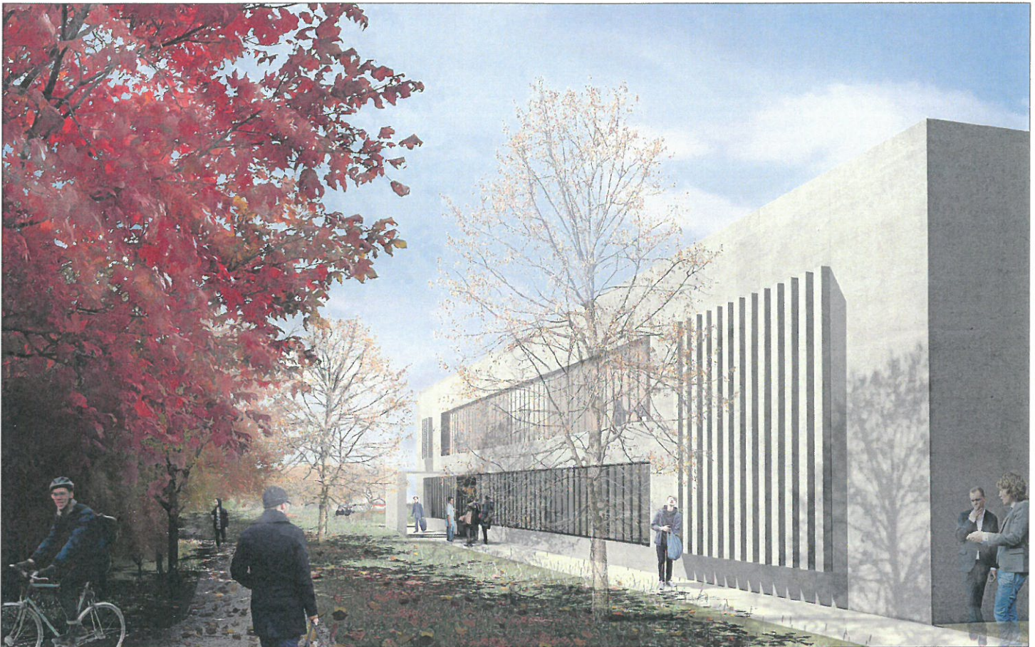
Museumsarkivet, der opføres i Høje-Taastrup med start juli i år og aflevering juni næste år, får et robust udtryk, og den skal fremstå enkel og neutral. Beplantningen omkring den skal være lidt vildt - i stil med grundens nuværende karakter. Illustration: Base Erhverv